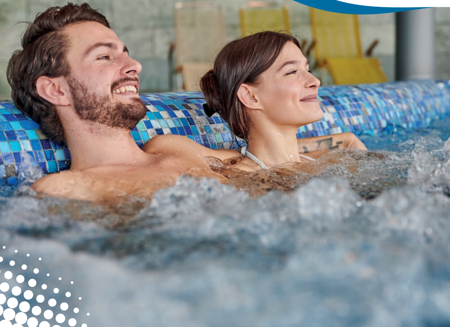
ARDESIA-Therme Bad Lobenstein

Weitere Infos: www.kombus-online.eu/wanderbusthueringermeer